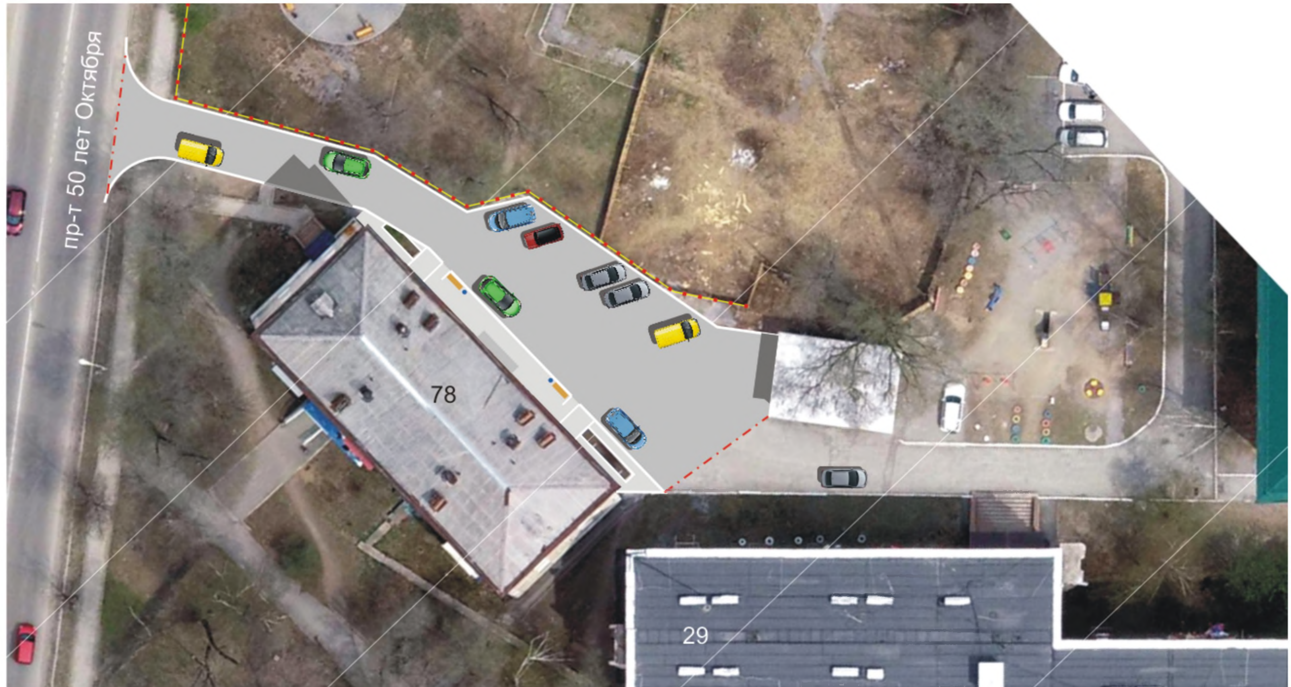
Существующее состояние придомовой территории.